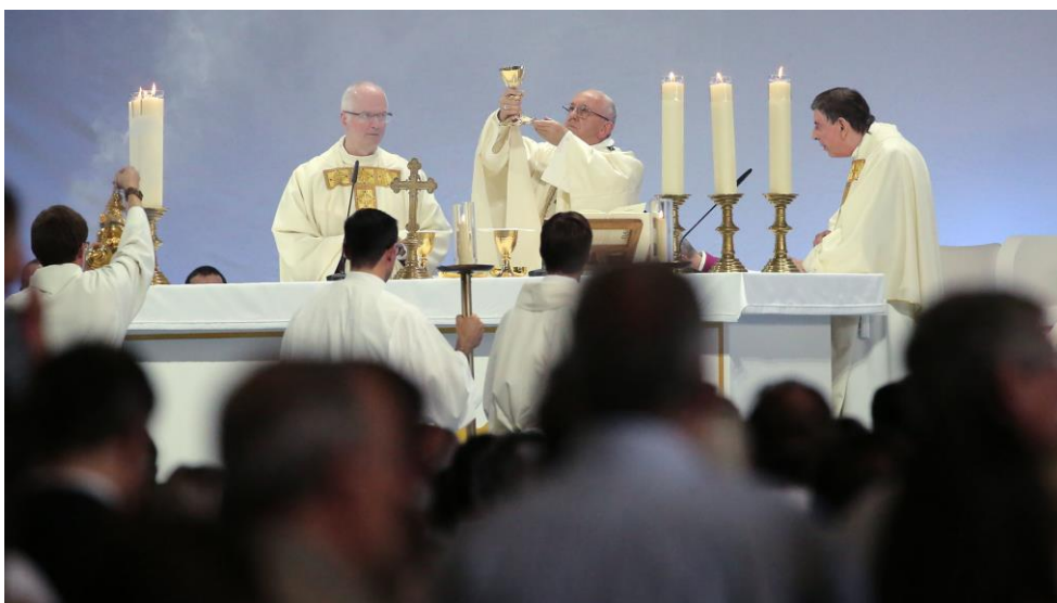
La messe avec le pape François, le 21 juin, à Palexpo, temps fort de l'année 2018