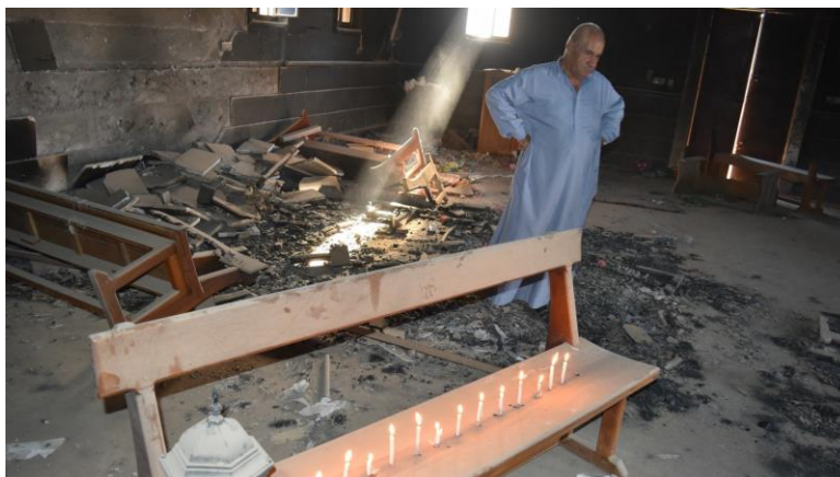
En Irak, une église de Qaraqosh saccagée par les djihadistes de Daech

Bernard Hallet à Oran en Algérie; Jacques Berset en Irak, au Panama et au Nicaragua, en lien avec AED).