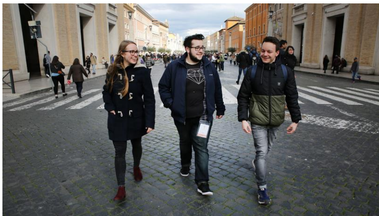
Les trois délégués suisses du pré-synode sur les jeunes, à Rome, en mars 2018

L'actualité de 2018 a boosté la fréquentation du site. La visite du pape François à Genève, le 21 juin, a notamment aidé à faire connaître cath.ch. Pour l'anecdote, le site a été cité par le New York Times pour avoir annoncé en exclusivité la venue du pape dans la ville de Calvin.